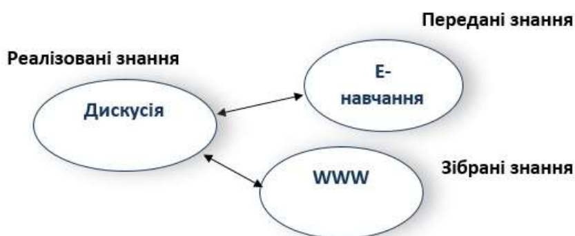
Рис. 2. Еволюція електронного навчання

Ключовими термінами цього періоду є Інтернет, Web-курси, гіпертекст, віртуальне навчання, віртуальний університет, неперервна освіта, навчання протягом усього життя, дистанційне навчання, електронне навчання та мобільне навчання.